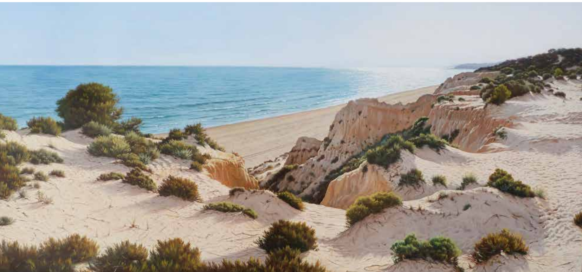
PASEANDO POR MAZAGÓN Óleo y alquídico sobre lino encolado a madera 150x70 cms.